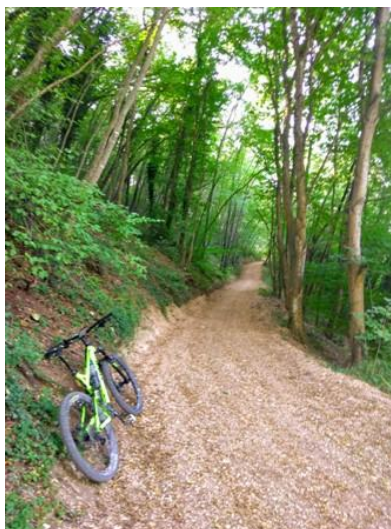
Costa delle Serre