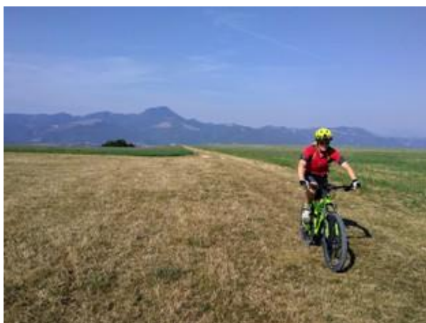
Pian dei Conti