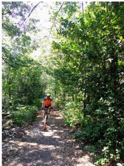
Bosco delle Tassinete

Al termine della cicloescursione possibilità di pranzo presso il ristorante "Le Cascatelle" di Cingoli con menù alla carta. Si prega di darne adesione in fase di iscrizione